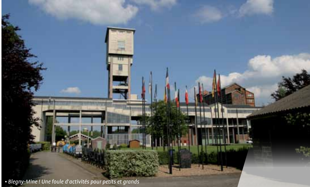
• Blegny-Mine ! Une foule d'activités pour petits et grands