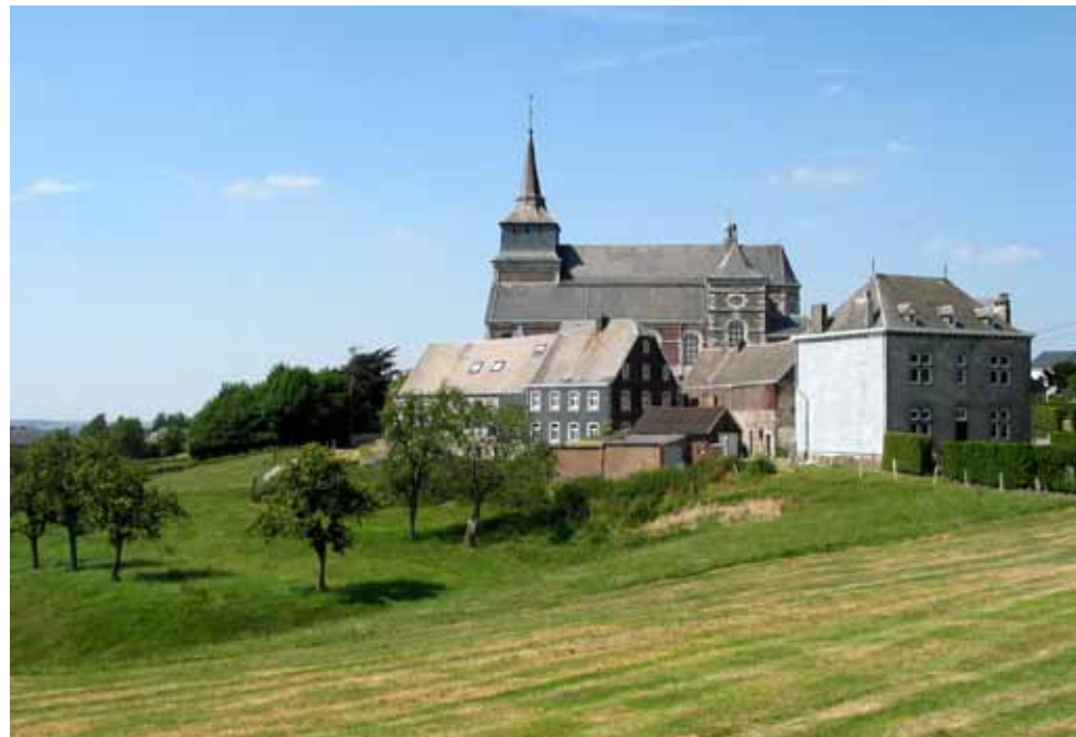
• Clermont-sur-Berwinne, un des plus beaux villages de Wallonie.

Visite sur rendez-vous Rue L. Jungling 29 Tél. +32 (0)4 387 72 43 www.chocolaterie-schonmacker.be