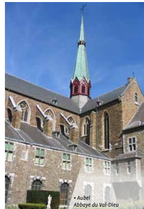
• Aubel Abbaye du Val-Dieu

Franchissez le pont Malakoff surplombant la ligne de chemin de fer et dirigez-vous vers le village de Bolland. Arrêtez-vous un instant au centre du village pour y découvrir le château et son vaste domaine, le plus grand ensemble classé du Pays de Herve.