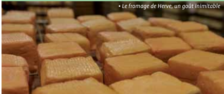
• Le fromage de Herve, un goût inimitable