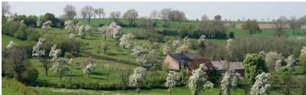
• Le Pays de Herve : un paysage rural d'exception