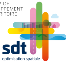
SCHÉMA DE DÉVELOPPEMENT DU TERRITOIRE

Conformément aux dispositions du CoDT, le projet de SDT sera soumis à enquête publique du 30 mai au 14 juillet 2023. Les documents officiels seront consultables sur le site sdt.wallonie.be à partir de mi-mai.