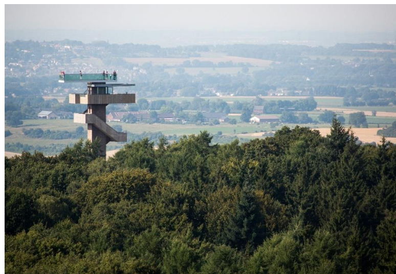
Uitzicht vanaf het Drielandenpunt in Vaals / Vue des Trois Bornes à Vaals