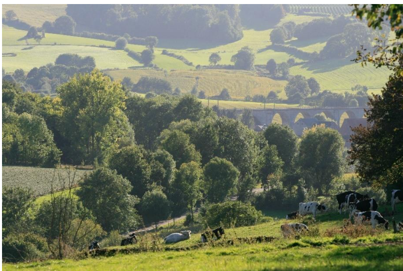
Bocagelandschap in de Vlaamse Voerstreek / Paysage bocager dans la région flamande des Fourons