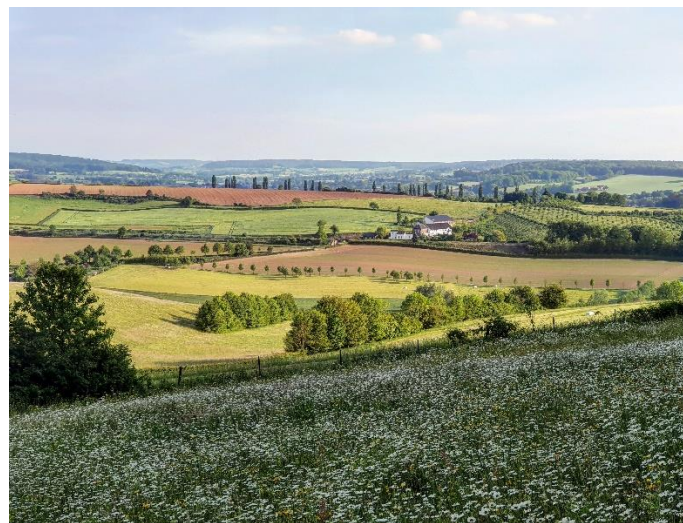
Typisch landschap in het Nederlandse Heuvelland / Paysage typique au "Pays des Collines" hollandais