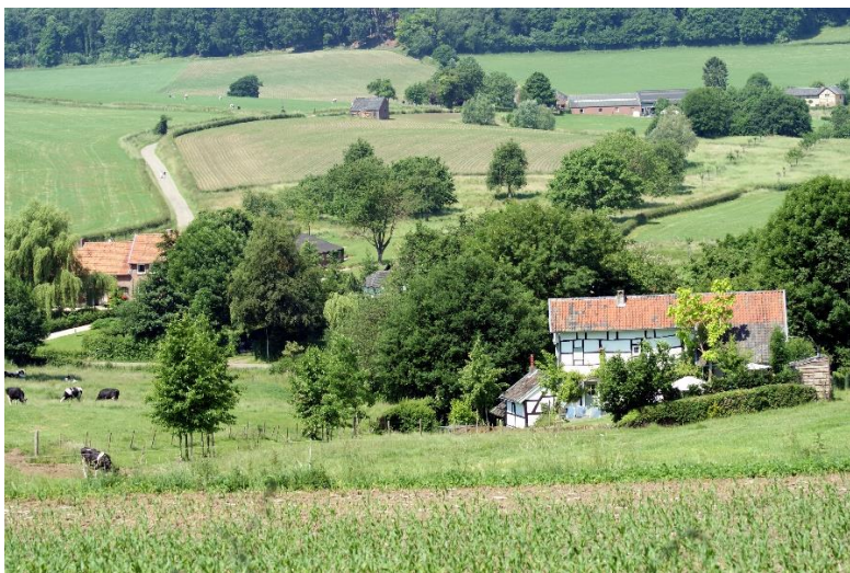
Bocagelandschap in het Waalse Land van Herve / Paysage bocager au Pays de Herve