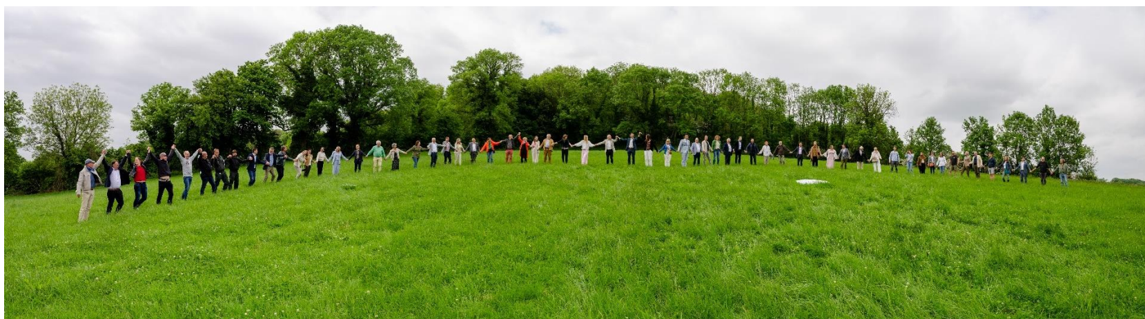
In het landschapspark Grenzeloos Bocageland staan “de lijnen de ons verbinden” voor de lijnvormige landschapselementen kenmerkend voor het bocagelandschap en de sociale relaties in het gebied. Dans le parc paysager Pays du Bocage sans Frontières « les lignes qui nous relient » représentent les éléments paysagers en forme de ligne caractéristiques du paysage bocager et les relations sociales dans la région.